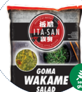
« (1141) ENSALADA ALGAS WAKAME -CONG- (SIN GLUTEN) 1kg ITA-SAN - KREYENHOP