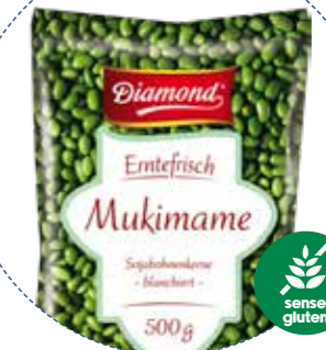
(1129) MUKIMAME (EDAMAME PELADO) GRANOS DE SOJA -CONG- (SIN GLUTEN) 500gr DIAMOND - KREYENHOP »