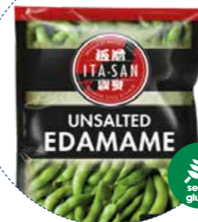
« (1128) EDAMAME VAINAS DE SOJA -CONG- (SIN GLUTEN) 400gr ITA-SAN - KREYENHOP