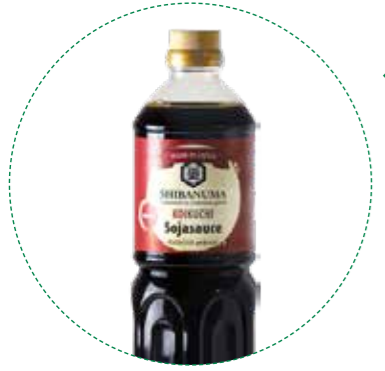
« (1103) SALSA DE SOJA 1L SHIBANUMA KREYENHOP