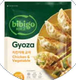
(1126) GYOZA DE POLLO Y VERDURAS -CONG- 600gr (30u x 20gr) BIBIGO - KREYENHOP 30 unitats per bossa »