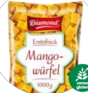
(1130) DADOS DE MANGO (2 x 2cm) -CONG- (SIN GLUTEN) 1kg DIAMOND - KREYENHOP »