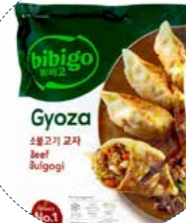
« (1127) GYOZA DE TERNERA Y VERDURAS -CONG- 600gr (30u x 20gr) BIBIGO - KREYENHOP 30 unitats per bossa