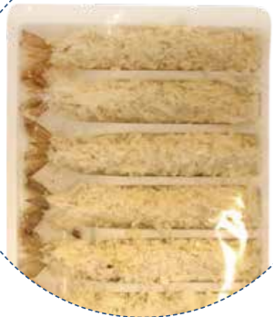
« (1135) LANGOSTINOS REBOZADOS -CONG- 250gr (10u x 25gr) SEACON - KREYENHOP 10 unitats per safata