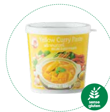
« (1098) PASTA DE CURRY AMARILLA (SIN GLUTEN) 400gr COCK - KREYENHOP