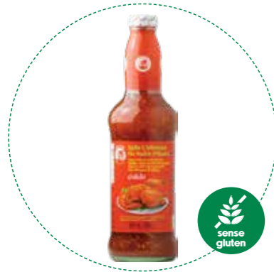
« (1100) SALSA DE CHILI DULCE (SIN GLUTEN) 800gr COCK - KREYENHOP