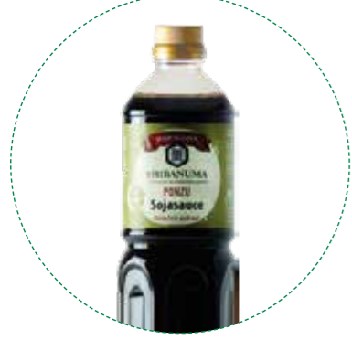
« (1105) SALSA PONZU CON YUZU 1L SHIBANUMA - KREYENHOP