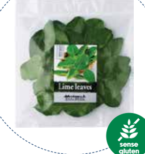
(1134) KAFFIR HOJAS DE LIMA -CONG- (SIN GLUTEN) 100gr THAI PRIDE KREYENHOP »