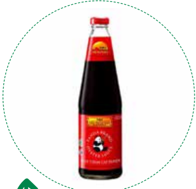
« (1107) SALSA DE OSTRAS PANDA 907gr LEE KUM KEE - KREYENHOP

La més venuda del món! Utilitza-la per potenciar el sabor de plats de peix, carn, verdures i arrossos. També és ideal per paella.