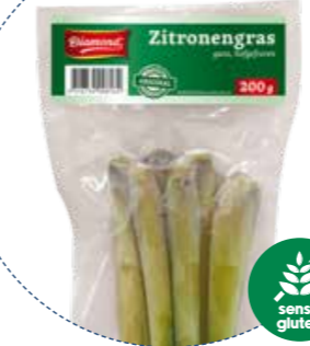
« (1136) LEMON GRASS CITRONELA -CONG- (SIN GLUTEN) 200gr DIAMOND - KREYENHOP