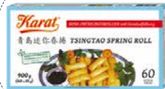
(1140) MINI ROLLITOS DE PRIMAVERA TSINGTAO CON VERDURAS -CONG- (60u x 15gr) KARAT - KREYENHOP 60 unitats per caixa »