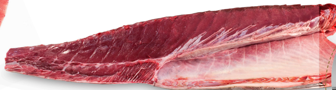
⌄ LLOM BLANC SENCER