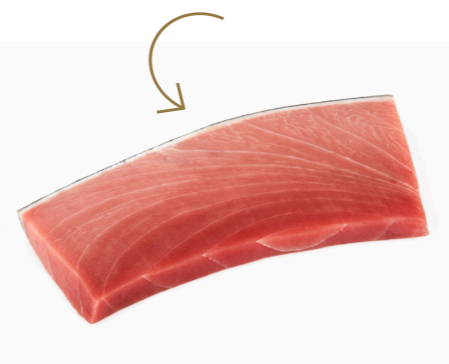
⌄ (10205) TABLETA individual ATUN BIG EYE S/SANG CONG.