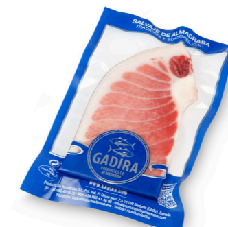
⌄ (8731) VENTRESCA DE ATUN ROJO SALV. FILETE IND. 200G CONG. - GADIRA