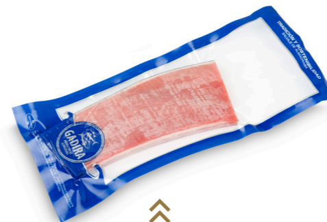
⌄ (8730) TARANTELO ATUN ROJO SALV. FILETE IND. 200G CONG. - GADIRA