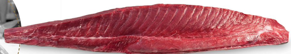
⌄ LLOM NEGRE SENCER