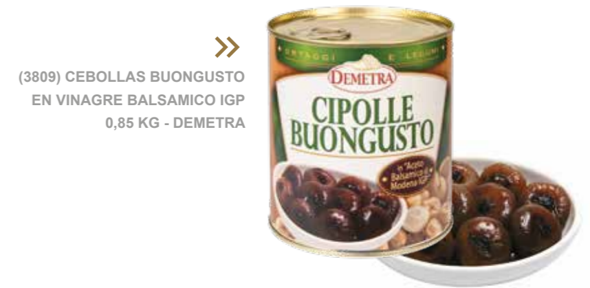
» (3809) CEBOLLAS BUONGUSTO EN VINAGRE BALSAMICO IGP 0,85 KG - DEMETRA