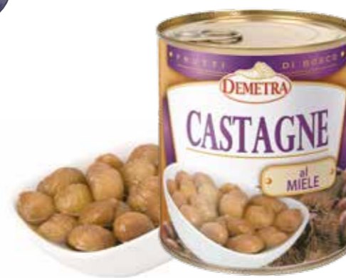
» (3729) CASTAGNE AL MIELE 1KG