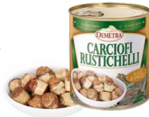
» (3472) ALCACHOFAS RUSTICHELLI IN OGLIO 0,77 KG - DEMETRA