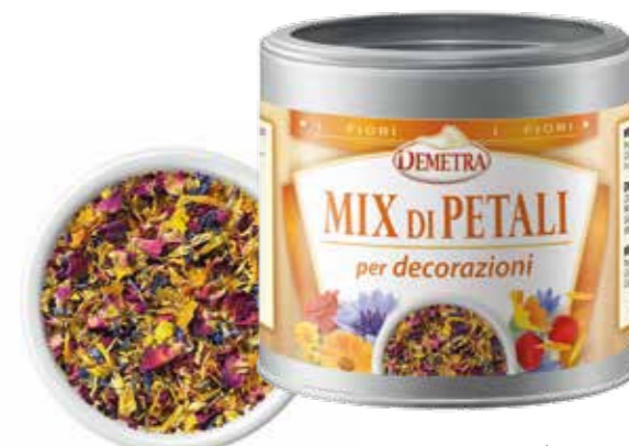
» (247) MEZCLA DE FLORES COMESTIBLES PARA DECORACIÓN 25GR - DEMETRA