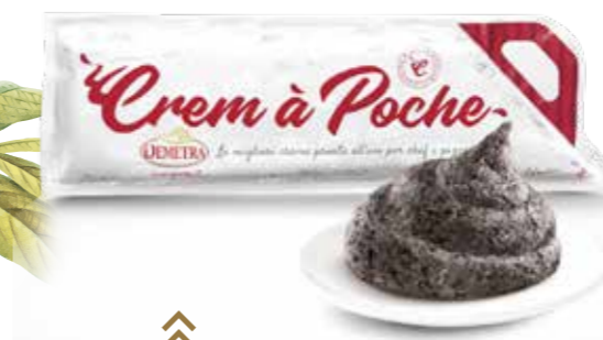
» (232) CREMA TRUFADA "RICETTA TOSCANA" 600 GR - DEMETRA