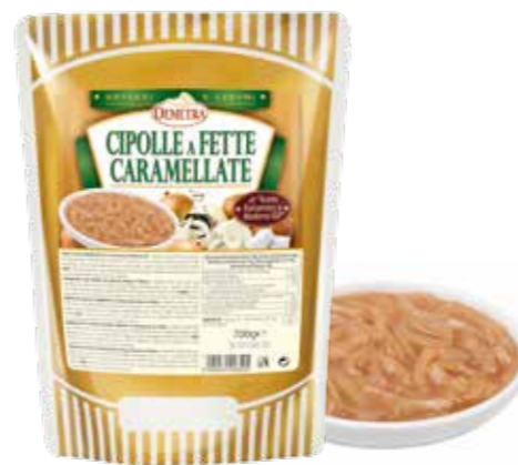
» (6641) CEBOLLA CARAMELIZADA BOLSA 0,7 KG - DEMETRA