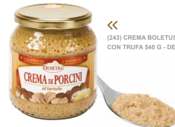
« (243) CREMA BOLETUS CON TRUFA 540 G - DEMETRA