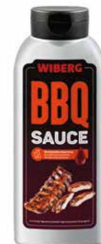
» (6635) SALSA BARBACOA 0,85 KG