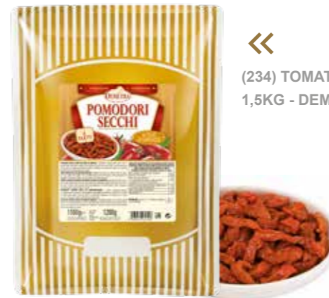
« (234) TOMATE SECO A TIRAS 1,5KG - DEMETRA