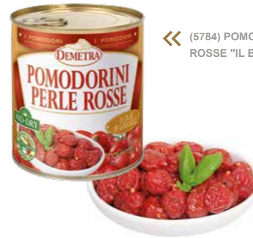
« (5784) POMODORINI PERLE ROSSE "IL BEBE" 0,8 KG - DEMETRA