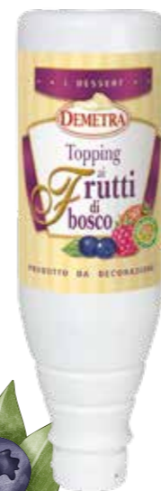
« (3718) TOPPING AL FRUTTI DI BOSCO 1KG DEMETRA