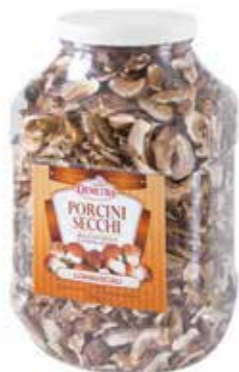
« (246) BOLETUS DESHIDRATADOS "COMMERCIALI" 500GR - DEMETRA