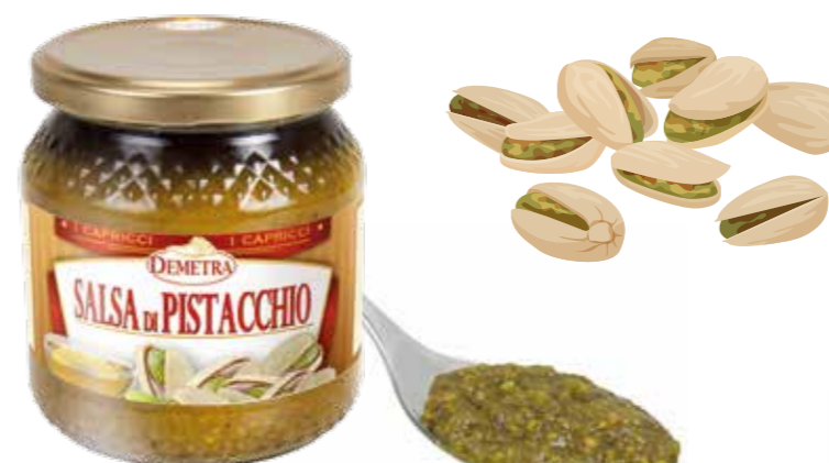
» (8040) SALSA DE PISTACHO 0,53 KG - DEMETRA