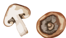
» (3807) FANTASIA DI FUNGHI TRIFOLATI 1KG - DEMETRA