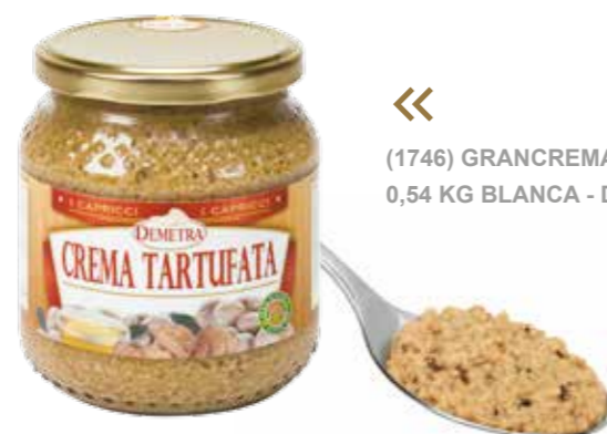
« (1746) GRANCREMA TARTUFATA 0,54 KG BLANCA - DEMETRA