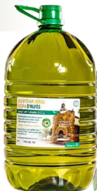
» (101) ACEITE VIRGEN EXTRA 5L