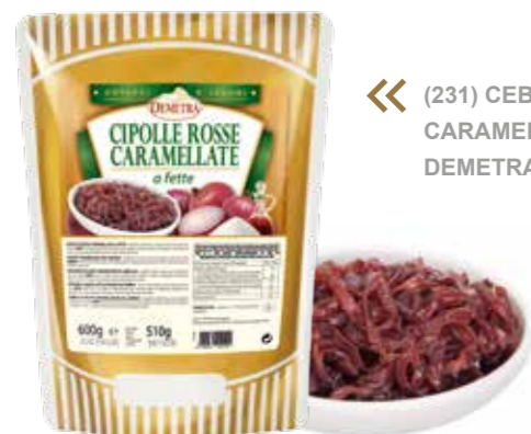
« (231) CEBOLLA ROJA CARMELIZADA BOLSA 600GR DEMETRA