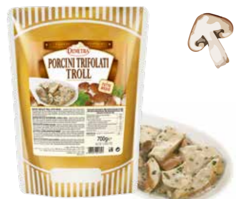
» (245) BOLETUS TROZOS EN CREMA DE PORCINI "TROLL" 700GR - DEMETRA