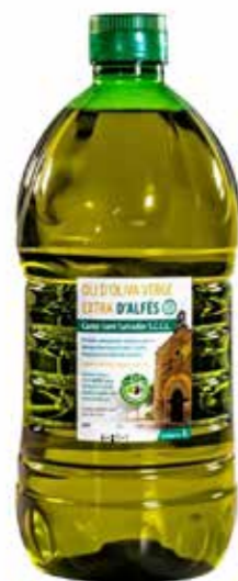
« (4897) ACEITE VIRGEN EXTRA 2L D.O.