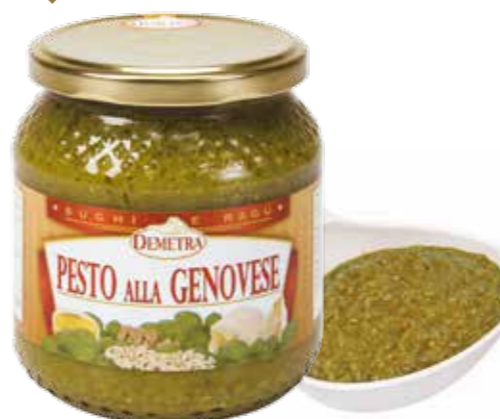
(5786) PESTO ALLA GENOVESA 0,54 KG - DEMETRA