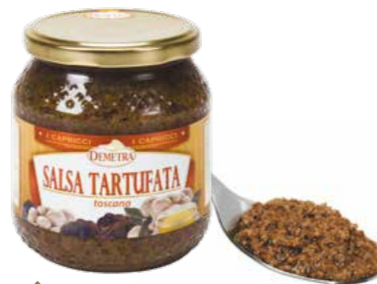
» (5785) GRANCREMA TARTUFATA 0,54 KG NEGRA - DEMETRA