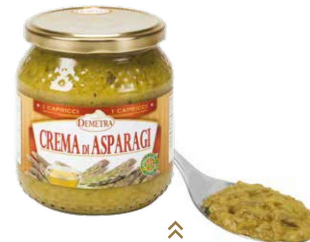
» (244) CREMA ESPARRAGOS TRIGUEROS 540G - DEMETRA