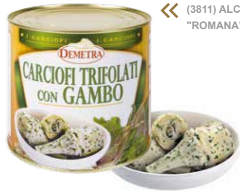
« (3811) ALCACHOFA TRIFOLATI "ROMANA" CON RABO 2,4 KG - DEMETRA