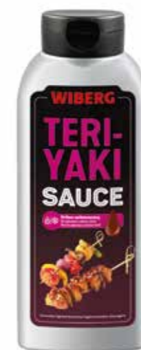
« (6631) SALSA TERIYAKI 0,8 KG - DEMETRA