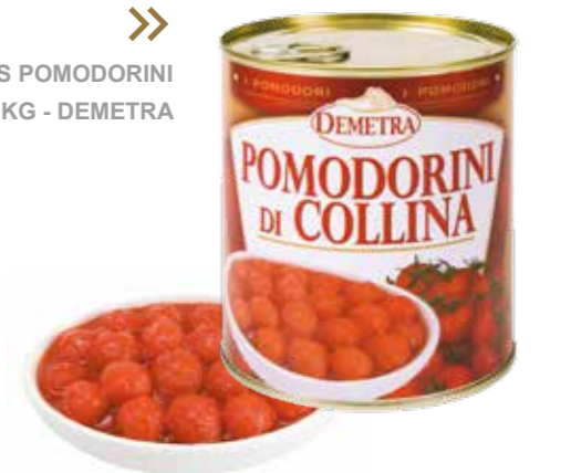
» (6614) PERLAS POMODORINI DI COLLINA 0,8 KG - DEMETRA