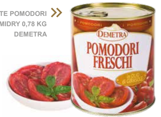
» (3812) TOMATE POMODORI "FRESCHI" SEMIDRY 0,78 KG DEMETRA