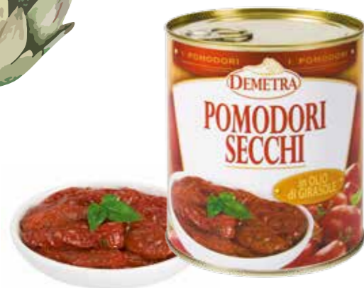
« (3813) TOMATE SECADO AL SOL 0,8 KG "POMODORI SECCHI" DEMETRA