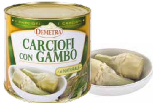
» (233) ALCACHOFA CON RABO AL NATURAL 3KG - DEMETRA